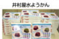
井村屋水ようかん