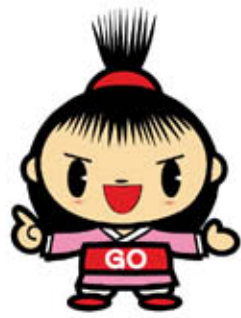
最優秀作品「ゴーちゃん」