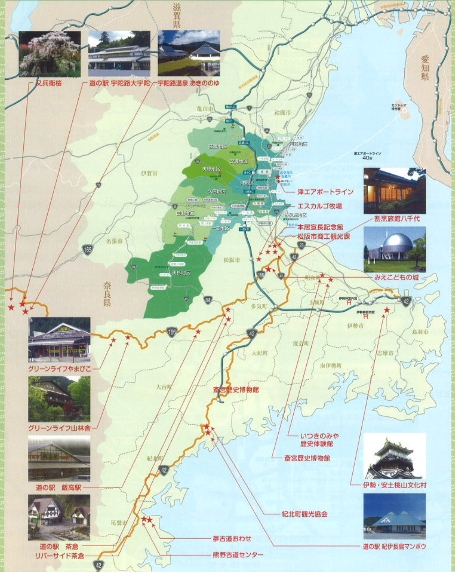
グリーンライフやまびこ

O.H.M.S.S.とは、「大宇陀・東紀州・松阪・サイトシーイング・サポート」の略で、観光業から進化したサイトシーイング業に携わる施設同士によって、地域間連携で導線に沿ったパブリシティを展開、サイト訪問者への便宜をはかると同時に、情報の交換と共有で、コースの提示や協同企画などを意図する、民間プロデュースのボランティア・ネットワークです。